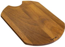
Planche de découpe en bois Iroko 8648 002