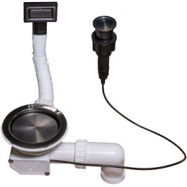
Vidange automatique Space Push Gun Metal - PO